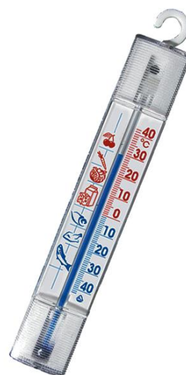
Рис.9 Термометр для холодильника