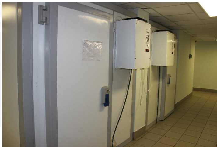
Рис. 1 Холодильное оборудование

При оснащении производственных помещений следует отдавать предпочтение современному холодильному и технологическому оборудованию (Рис.1).