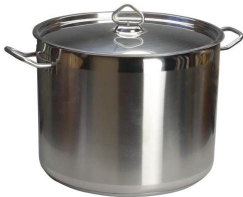
Рис.5 Котел из нержавеющей стали

Посуда для приготовления и хранения готовых блюд должны быть изготовлены из нержавеющей стали.